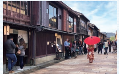
風情ある街並みの『ひがし茶屋街』。

オープンキッチンということもあり、毎日の掃除を徹底し、清潔には気を遣っていますが、新しいエアコンで使い勝手は満足しているので、清潔面にも期待したいですね。