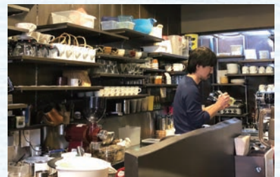
心のこもったコーヒーを提供されておられます。