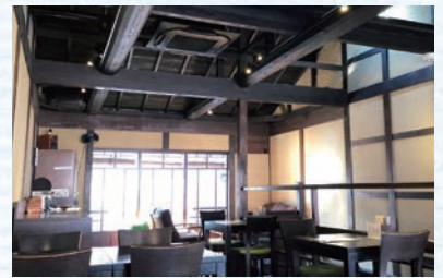
内装に合わせたブラックパネルを採用。