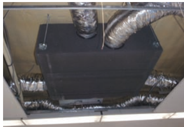
部屋ごとにDESICAを設置。全館で40台。