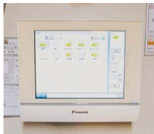
▲集中コントローラで一括管理