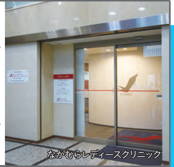
なかむらレディースクリニック