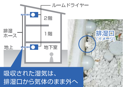
吸収された湿気は、排湿口から気体のまま外へ

また壁掛け式というのも、設計する側にとっては壁際のインテリアを有効に活かせるのでポイントが高いですね。