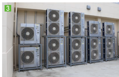
3 室外機は沖縄の潮風に耐える耐塩害仕様の塗装が施されている