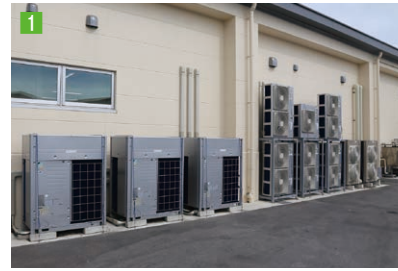
1 業務用マルチエアコン+スカイエアの室外機を配置