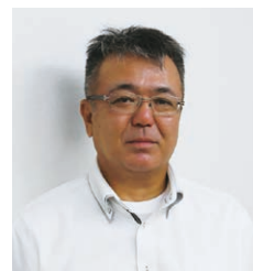
有限会社 長浜冷機

当初、売場の空調機は5馬力×14台で設計していましたが、DESICAによる除湿やショーケースからの冷気を考慮して、5馬力を4馬力にサイズダウンでき、喜んでいただきました。常に熱意をもって最新の省エネ対策に取り組まれている野高商会様のビジョンを、着実に具現化できればと思っています。