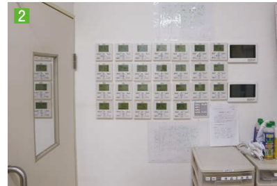
2 管理室にコントローラーを集約