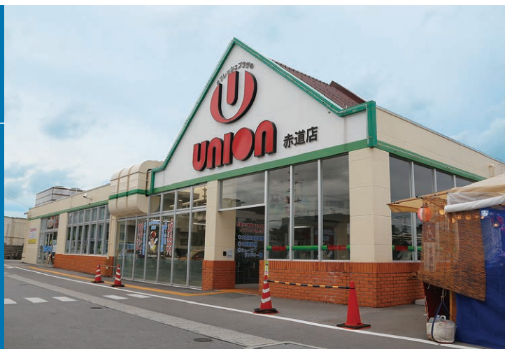
2018年5月にオープンした2,000m 2 を超える大型店舗「ユニオン赤道店」