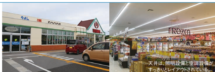
天井は、照明設備と空調設備がすっきりとレイアウトされている。

「フレッシュプラザ ユニオン」は沖縄県で18店舗展開する地域のスーパーマーケット。全店舗24時間年中無休で営業しています。テレビCMのキャッチフレーズ「今あいてます」「ユニオンですから」は地元で知らない人がいないほど親しまれています。