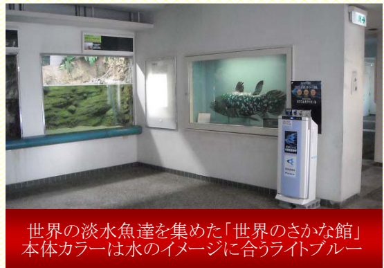
世界の淡水魚達を集めた「世界のさかな館」 本体カラーは水のイメージに合うライトブルー

「世界のさかな館」では鯉のエサを販売しており、そのニオイが館内に充満し、困っていました。ドアを開放して換気をしていましたが、夏や冬は開けっ放しにすることは難しく、以前から対策を検討していました。パワフル光速ストリーマを導入してからは、「ニオイが軽減した」とスタッフから喜びの声。半地下にあるので、空気がこもりやすい場所でしたが、パワフル光速ストリーマは大風量なので、空気が循環されている感じがします。