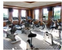
鶴水スポーツクラブ

サンパーク犬山ホームページ http://www.sunpark-inuyama.com