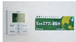
「Ecoエアコン運転中」で省エネ姿勢をお客さまにもアピール

官から民に経営が変わったのだから、当然、抑えるところはどんどん抑えていきます。その点、名前にもあるように、80%も省エネ率がよいというのは大きな魅力ですね。お客さまの多い少ないで自動的に能力を調整してくれるのも嬉しい。今の時代、コストメリットが大きいことは必須条件でしょう。