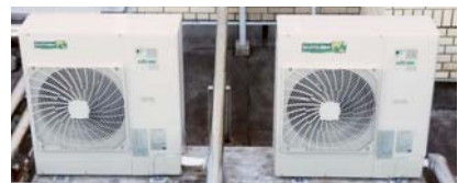
室外機にも「Eco エアコン運転中」のステッカー貼付