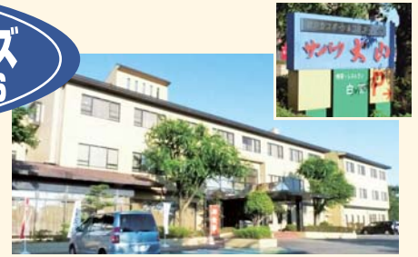
温泉、レストラン、ラウンジからスポーツジム、会議室まで揃った宿泊型スポーツ&コミュニティ施設。 経営：株式会社鶴水スポーツ(本社：愛知県豊田市)