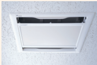
CO 2 センサー付き全熱交換器(ペンティエール)

この3年で換気への意識は、完全に根付きましたね。 エアコン更新と一緒に、CO 2 センサー付き全熱交換器に更新しました。 CO 2 濃度をリモコンで確認できるのは安心材料のひとつですね。 その他にも、天井埋込カセット形UVストリーマ空気清浄機もご提案いただき事務所と会議室に採用しました。 コロナウイルスへの対策は今後も必要と考えますので安心できる材料はひとつでも増やしていきたいと思ひます。