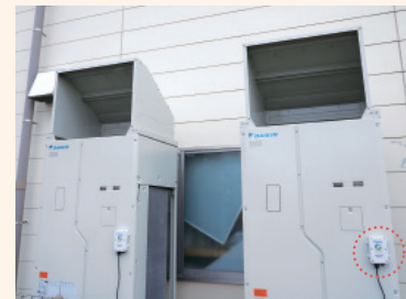
室外機には防雪フードを装着