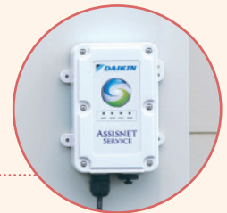
アシスネット (IoT端末)