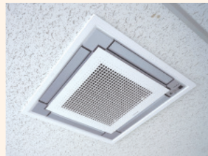
天井埋込カセット形UVストリーマ空気清浄機