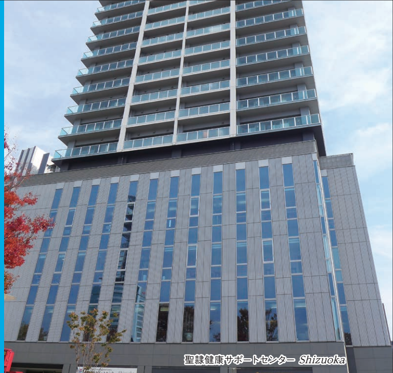
聖隷健康サポートセンター Shizuoka