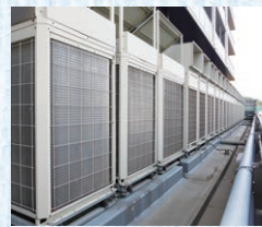
ビル用マルチエアコンの 室外機。

点検対象機器の調査から、 法対応プランの提示まで、 安心して任せることができました。