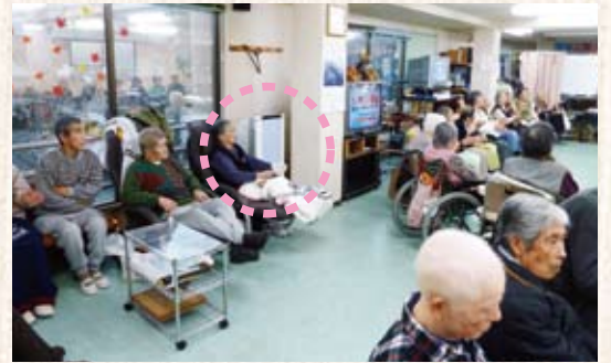
2階の通所リハビリテーションにはライトブルーを2台採用。