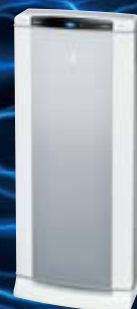
ACEF12L-S (メタリックシルバー)