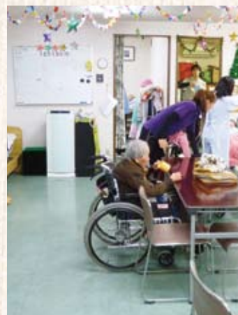
3階のデイサービスセンターにはミントグリーンを2台設置。