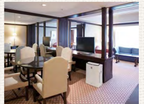
27階と28階の「スイート」。