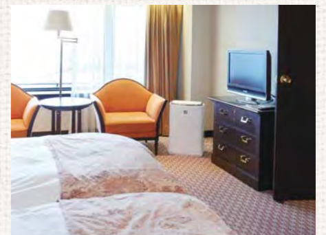
28階の「スイート」の寝室。