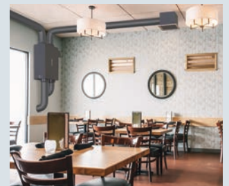
室内の壁面に(改装対応)