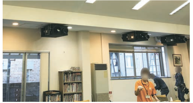
施設閉館後に施工

納入機器：全熱交換器ユニット ベンティエール 露出設置形：13台(2020年12月納入)