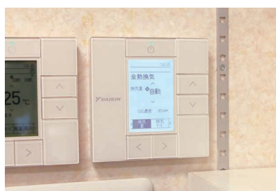
リモコンにCO 2 濃度が表示されている