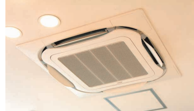
ストリーマ除菌ユニットも導入