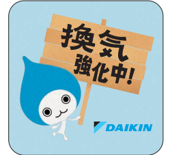
換気強化中ステッカー