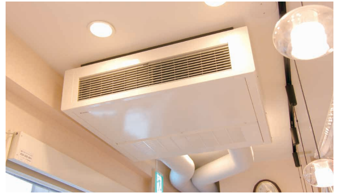
全熱交換器ユニット ベンティエール 天井吊形

これからも、地域の皆様により安心してご利用いただけるように していきたいですね。