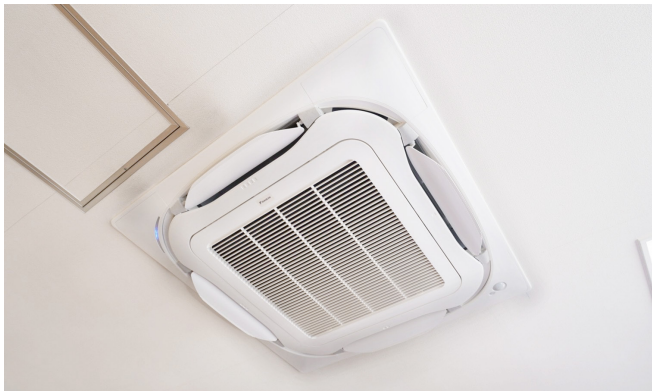
UVによる高い除菌効果が自慢の『UVストリーマ除菌ユニット』