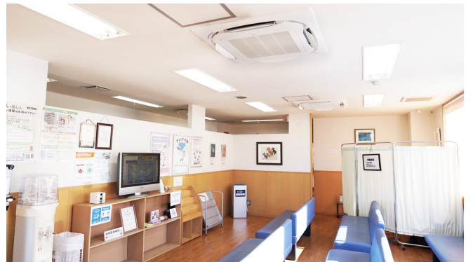
しっかりと感染症対策のされた待合室