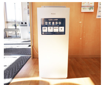
待合室には『UV加湿ストリーマ空気清浄機』