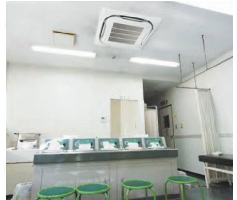
FIVE STAR ZEAS 室内機設置写真

以前から事務室などにはダイキンのエアコンを採用しています。空調の専門メーカーとして信頼していましたが、今回、三重石商事さんから業務用の新しいエアコンが出たと聞き、ぜひ設置したいと思いました。なかでも、 人検知センサーと床温度センサーの「センシング機能」 で、 人に風を当てずに空間全体を快適にする、という優しい配慮が魅力 でしたね。