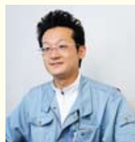
アール空調システムズ 株式会社 サービス課 浅野様

M様はエコロジー関係の仕事に携わっておられ、エアコン選びでも省エネ性能がポイントでした。また息子様からのお勧めもあり、「うるるとさらら」ご指名で設置のご相談をお受けいたしました。「うるるとさらら」は湿度調整により快適性と省エネ性を両立できるのでM様にぴったりのエアコンでした。また、以前のエアコンと同じ部屋隅に設置させて頂きましたが、「4方気流」の横吹き出で、空間全体を快適にする点もご満足いただけたようです。これからも「4方気流」を多くのお客さまにおすすめしていきたいですね。