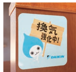
換気強化中ステッカーも 利用いただいています