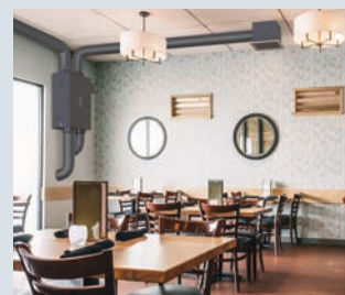
室内の壁面に（改装対応）