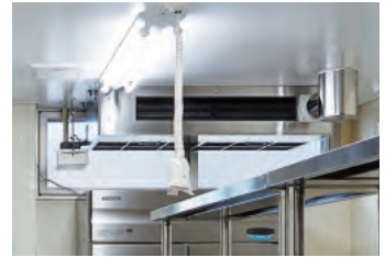
厨房には汚れにくく、油煙・蒸気にも強い厨房用エアコンを採用。