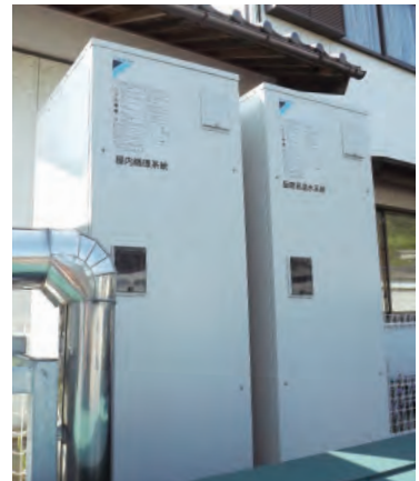
タイプ1を2台設置。食器洗浄などに使用する厨房高温水系統と手洗いやシャワーに使用する屋内循環系統に分けて使用。