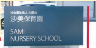
保育園のサインは「第五十四回 岡山屋外広告コンクール」で倉敷市長賞を受賞。