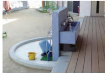
屋外の手洗い場にも給湯。