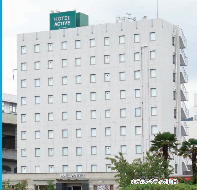
ホテルアクティブ山口