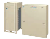
エコ・アイスminiマルチ